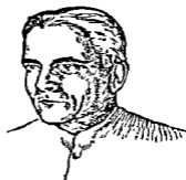
रंगनाथ रामचन्द्र दिवाकर

संस्कृत के अध्ययन के कारण हिन्दी भाषा का ज्ञान प्राप्त करना भी उनके लिए सरल बन गया। साहित्य में पहले से ही रुचि थी, अतः राजनीति के साथ-साथ साहित्य-सेवा भी धरावर चलती रही। १९२१ में 'कर्मवीर' नामक कन्नड़ साप्ताहिक निकाला और १९२३ से १९३४ तक एक अंग्रेजी साप्ताहिक का संपादन किया। स्वाधीनता-आन्दोलन में कारावास की अवधि का उपयोग उन्होंने अध्ययन तथा लेखन-कार्य में किया।